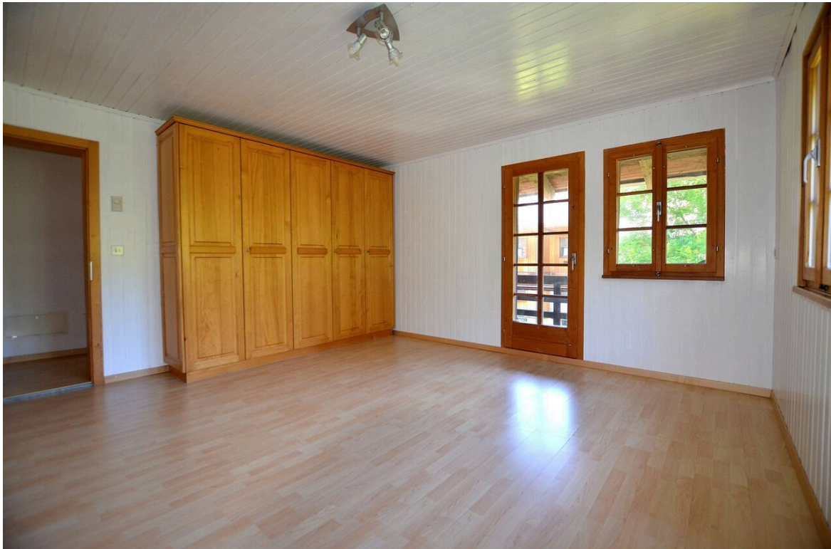
1. Schlafzimmer mit grossem Schrank und Zugang zum Balkon