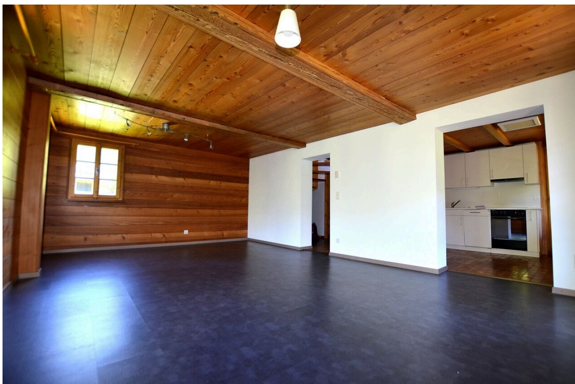
Wohnbereich mit direktem Zugang zur Küche