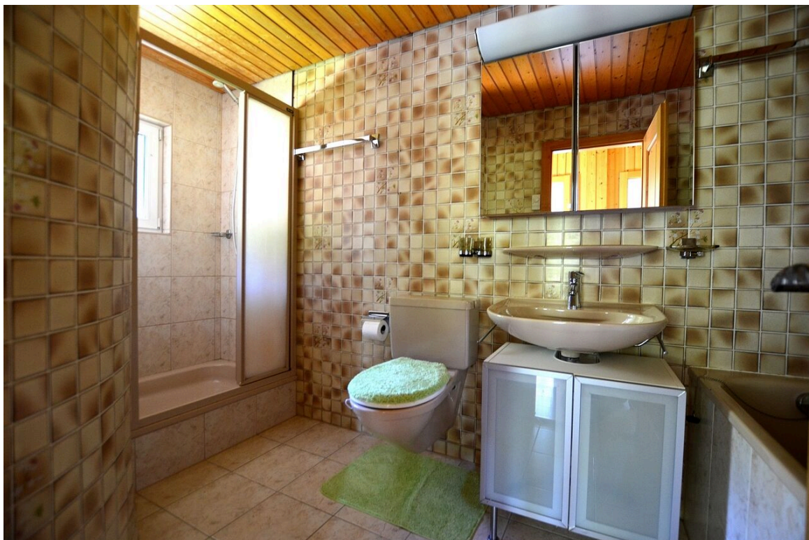
Bad mit Badewanne und Dusche