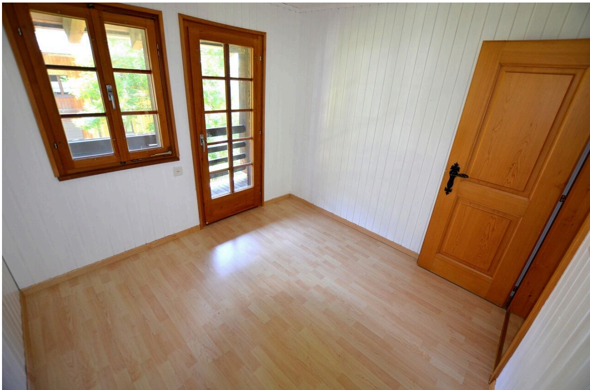
3. Schlafzimmer mit Zugang zum Balkon