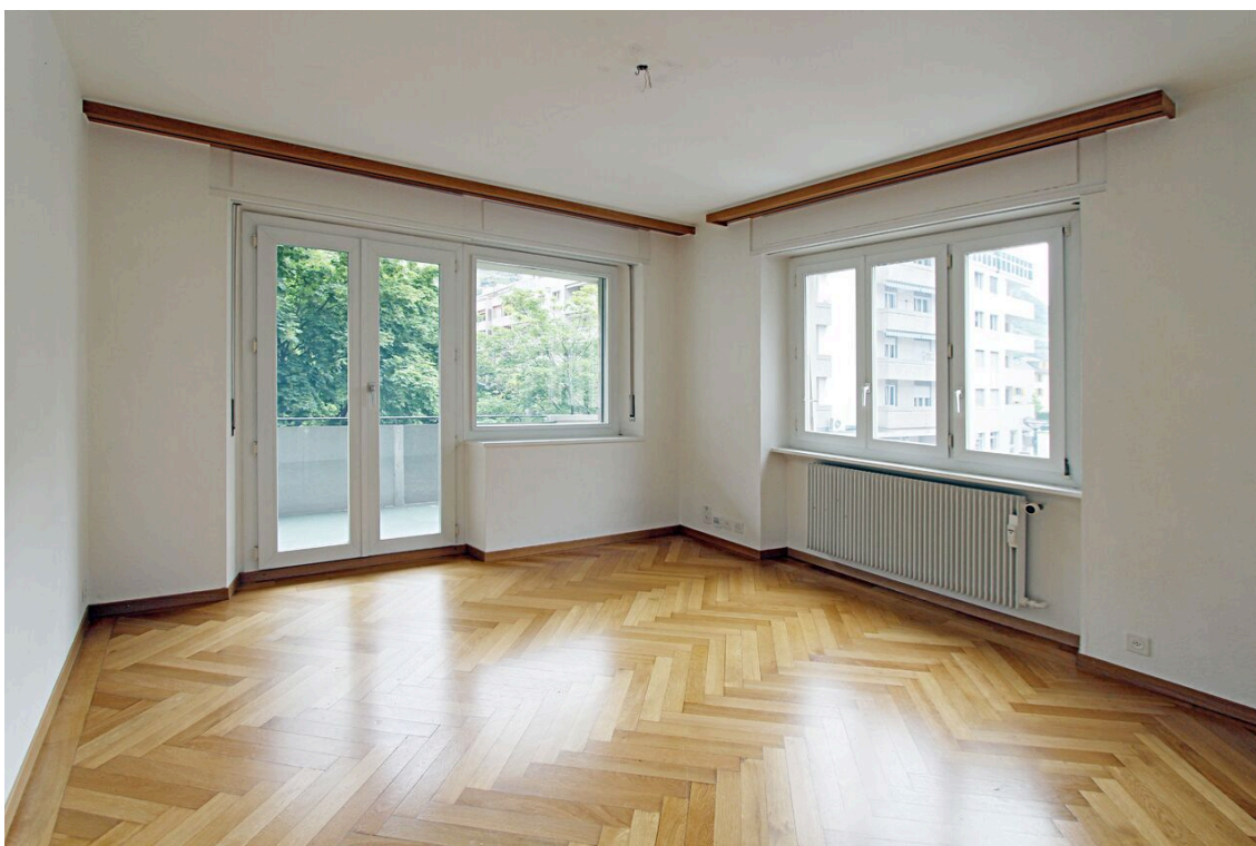
1. Schlafzimmer mit Balkon und Parkettboden