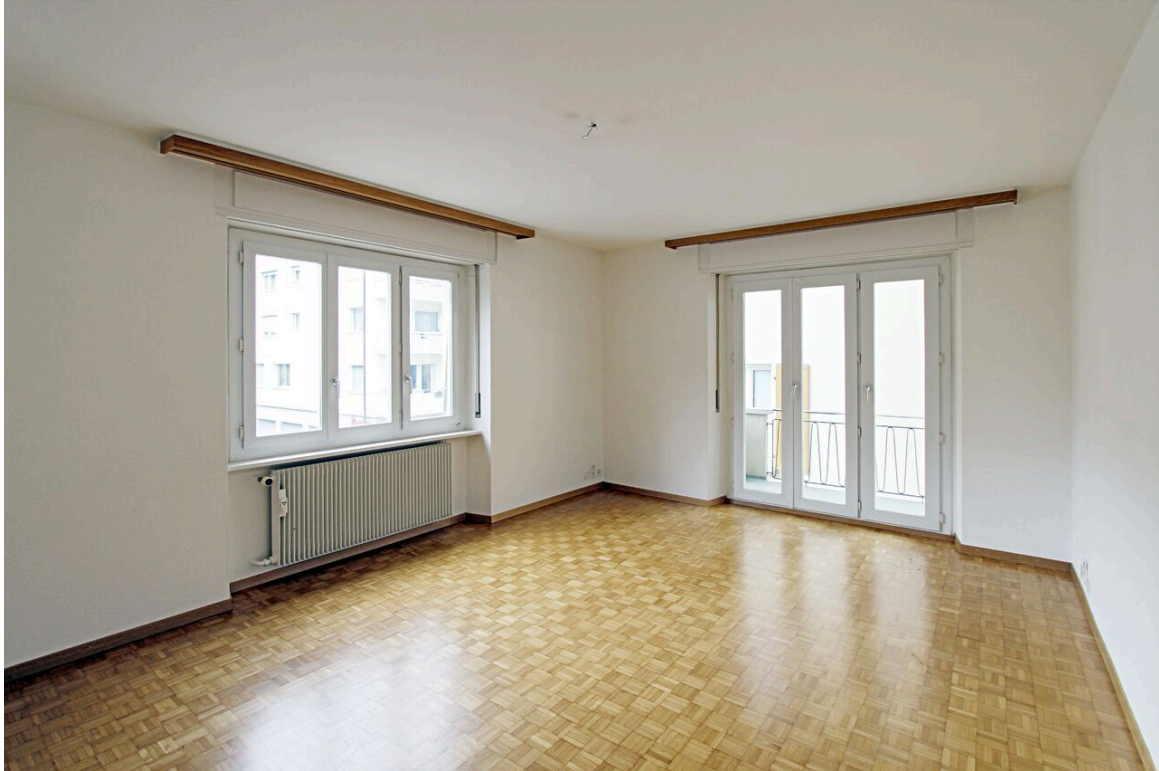
2. Schlafzimmer mit Balkon und Parkettboden